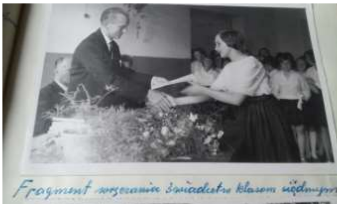
Fragment wyrażania świątecznych życzeń

Spółdzielnia Uczniowska natomiast wygospodarowała nadwyżkę w kwocie 6103 zł. Za część tych pieniędzy zorganizowała dla swoich członków bezpłatną wycieczkę do Warszawy. W okresie zimowym odbyły się dwie zabawy karnawałowe, dzięki którym na cele szkolne uzyskano 1100 zł. Rok szkolny 1959/1960 został zakończony bardzo uroczystie. Klasę siódmą ukończyło 42 uczniów, na stan 44.